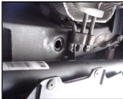
Anbau der AHK