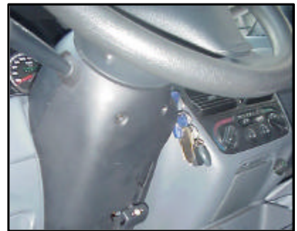
Anschluss des E-Satzes, entfernen der Lenksäulenverkleidung

Beiträge zur Erweiterung bzw. Vervollständigung unserer Informations- bzw. Bilddatenbank honorieren wir mit bis zu 50 Euro. Sollten Sie Interesse haben, setzen Sie sich bitte per E-Mail mit Herrn Auert unter o.auert@kupplung.de in Verbindung.