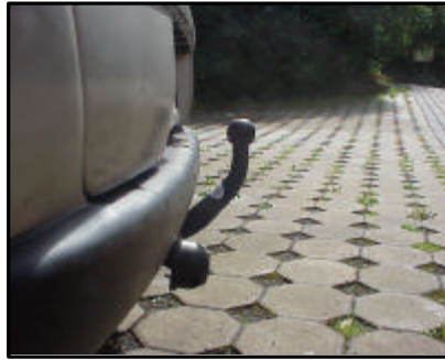
AHK von der Seite