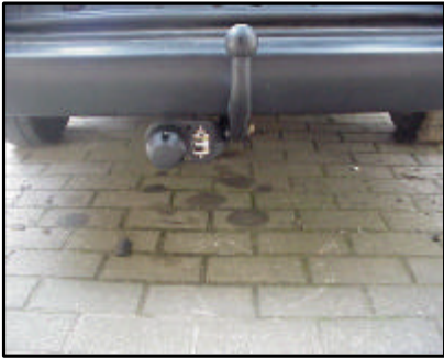
Fahrzeug mit AHK