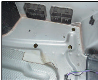
Befestigungspunkte innen rechts