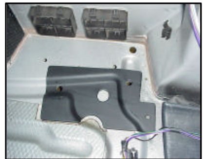
Einbau der Halteplatte