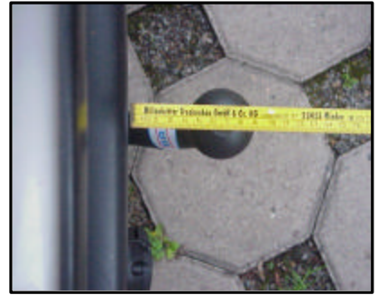
Abstand vom KK zur Stoßstange