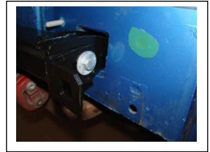
eingebaute montierte Anhängerkupplung rechts