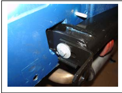
eingebaute montierte Anhängerkupplung links