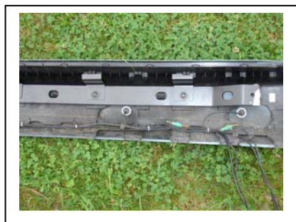
Stoßfänger mit Halter rechts