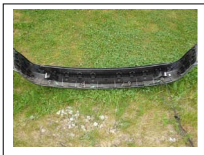
Stoßfänger mit Halter