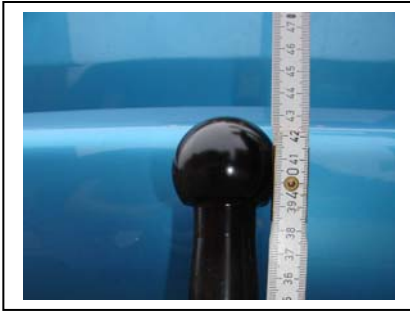
Abstand Fahrbahn – Kugelkopf